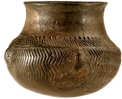
Abb. 2: Fundplatz 20, Rössener Kugelbecher, o. M..

Ziel des Projektes ist eine erstmals vollständige und systematische Aufarbeitung und Vorlage der Keramikinventare der Fundplätze Boberg 15, 15ost und 20, mit einer Einbindung dieser in die regionale Besiedlungsgeschichte. Die im Bereich der Boberger Niederung gelegenen endmesolithischen und neolithischen Fundstellen zählen bereits seit mehreren Jahrzehnten mit zu den wichtigsten Stationen für die Beurteilung der Neolithisierung Norddeutschlands und Südskandiaviens. Im Fundbestand typologisch fremd erscheinende Keramik lässt auf Kontakte der Bevölkerung zu weiter südlich lebenden, bereits vollagrarisch wirtschaftenden Siedlergruppen schließen. Das wohl prominenteste Beispiel bildet ein fast vollständig erhaltener Rössener Kugelbecher (Abb. 2)